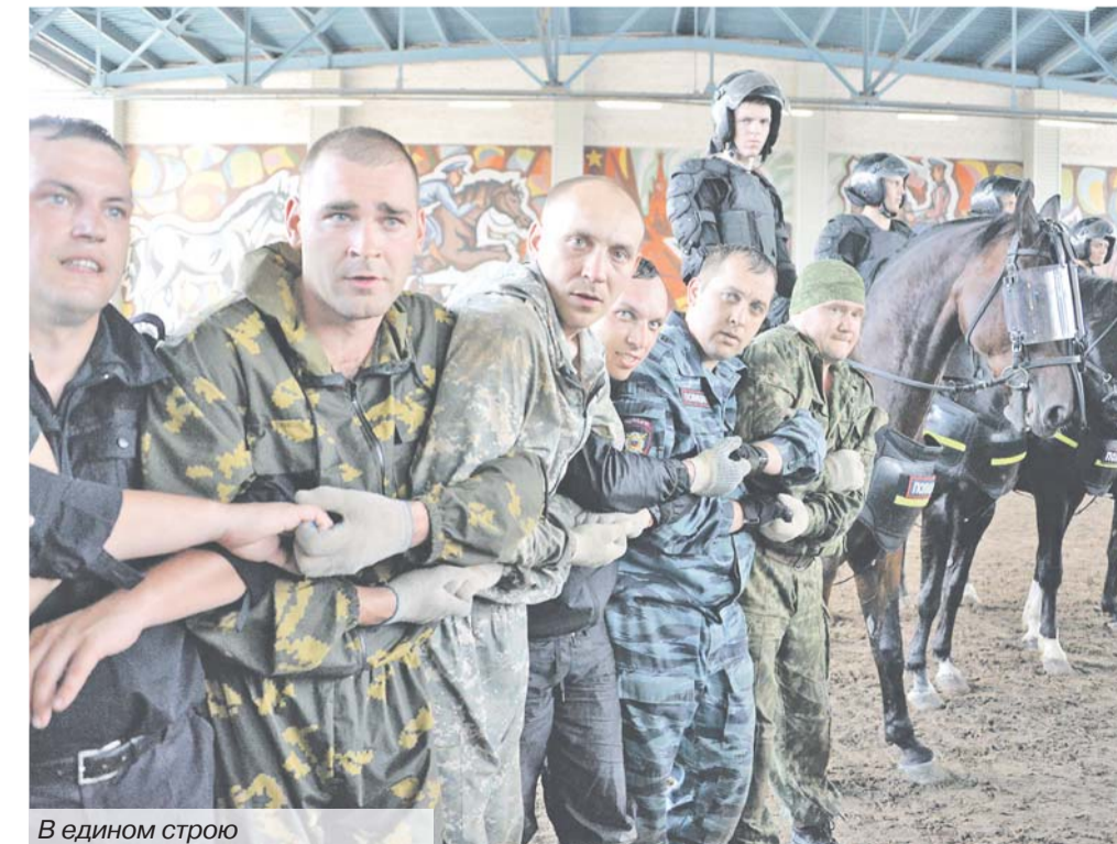
В едином строю