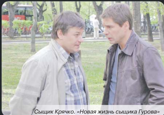
Сыщик Крячко. «Новая жизнь сыщика Гурова»