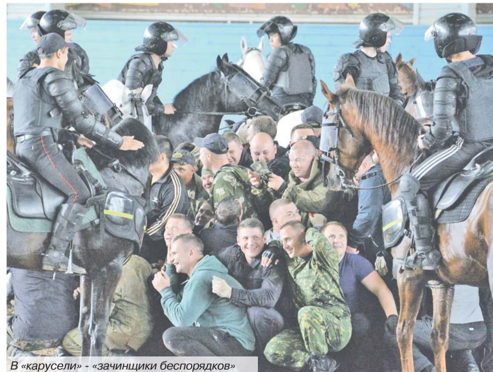
В «карусели» - «зачинщики беспорядков»