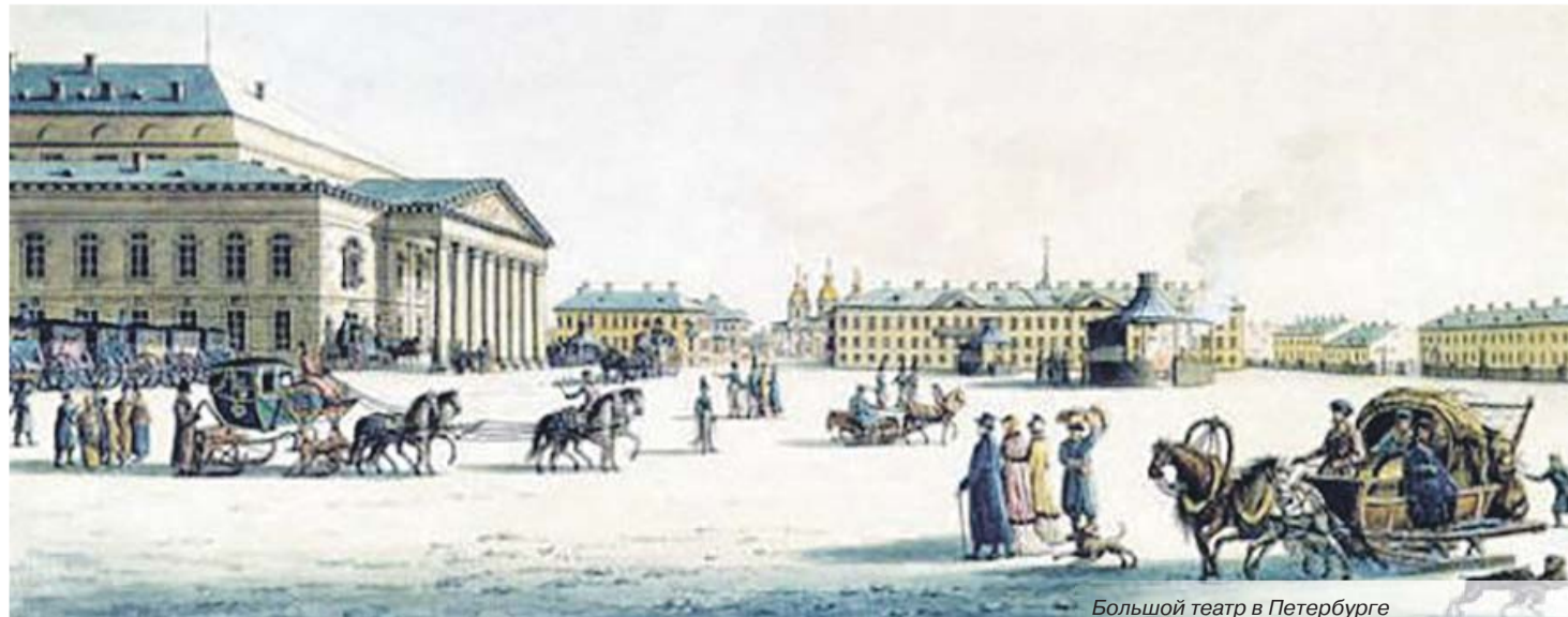
Большой театр в Петербурге