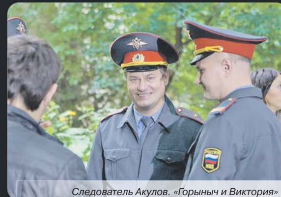
Следователь Акулов. «Горыныч и Виктория»