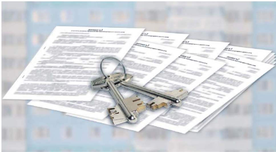
Коллаж Татьяна НОВИКОВОЙ

Продав одну и ту же квартиру 16 раз подряд, амурчанин заработал 14 млн рублей. Теперь он предстанет перед судом за мошенничество в особо крупном размере.