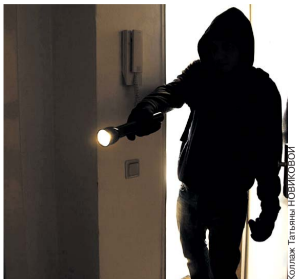
Коллаж Татьяна НОВИКОВОЙ

Общий ущерб от ночных вылазок опытного домушника составил 600 тысяч рублей. Во время обысков у ночного гостя изъяли часть похищенных вещей: кошельки, банковские карты и мобильные телефоны. А ещё у задержанного обнаружили три