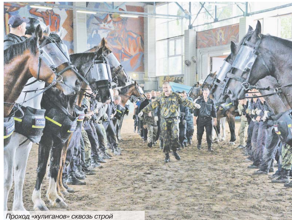
Проход «хулиганов» сквозь строй